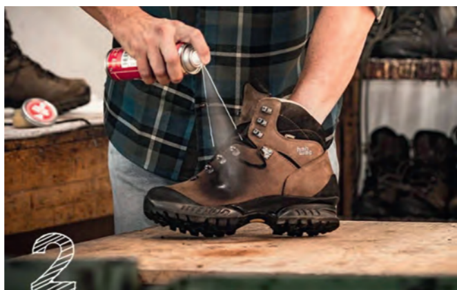
IMPREGNEREN MET SPRAY (PFC-VRIJ)

De Hanwag Care Sponge is zeer geschikt voor schoenen van nubuck - of suède leer. Het voedt het leer diep, verfrist de kleur en houdt het zacht en soepel zonder het natuurlijke, ruwe karakter aan te tasten. Tegelijkertijd impregneert de Hanwag Care Sponge het leer en verzorgt de rubberen delen, zoals bijv. de stootrand..