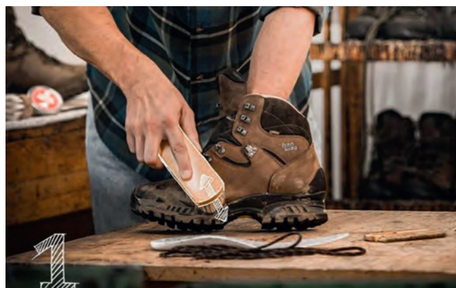
NA IEDERE TOCHT REINIGEN - inlegzolen en veters eruit halen

Buitenkant: Borstel de schoenen na iedere tocht af. Als het vuil te vast zit, verwijder het dan onder stromend water. Binnenkant: Textiele voering (zoals in de meeste GORE-TEX schoenen) of leren voering reinigt men het beste met schoon water en een spons. Geen heet water gebruiken!